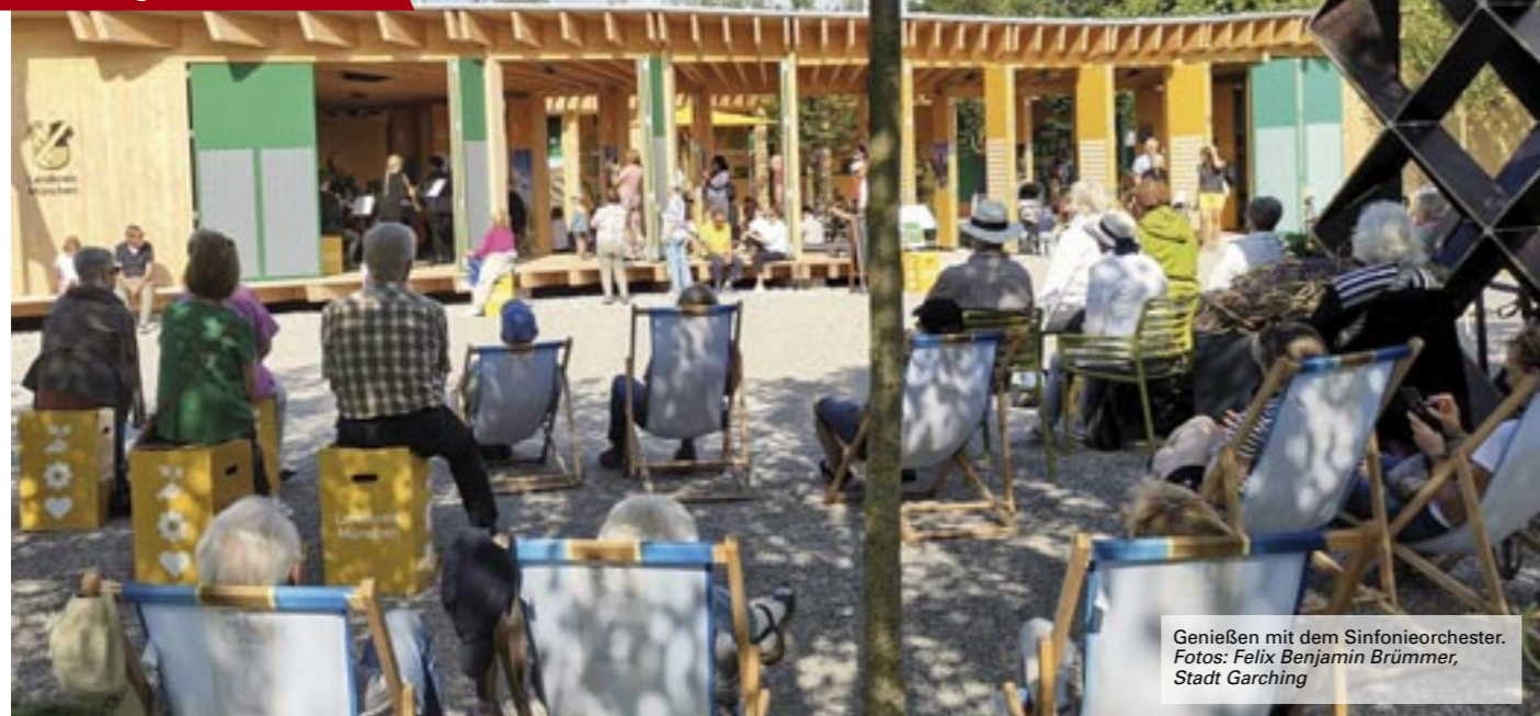
Genießen mit dem Sinfonieorchester.