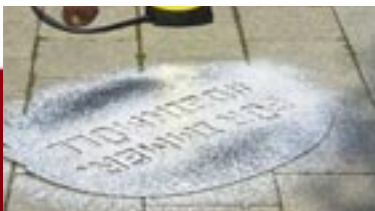
Gemalt: Straßenaktion Müllvermeidung

Die Stadt feiert im Festzelt und auf dem Straßenfest