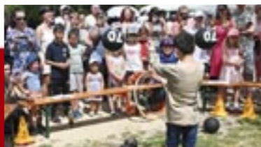
Gefeiert: Brückenfest in Hochbrück