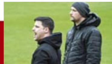
Gebastelt: Neuer Kader beim VfR