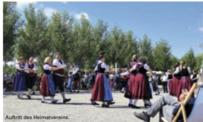
Auftritt des Heimatvereins.

Am Freitag gab die VHS Nord den Besuchern in einem spannenden Vortrag einen Einblick in das Verschwinden der Artenvielfalt und der Verein Kunst Kompass animierte die Gäste mit dem Malprojekt „Kunst-Rasen“ zum Mitmachen. Am Wochenende bot der Heideflächenverein eine Führung zu essbaren Wildkräutern und Heilpflanzen der Region an und hielt einen Vortrag („Mehr Blumen für