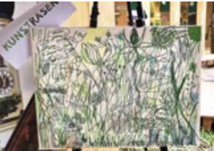
Das Mitmach-Bild Kunst-Rasen.

mit 29 Klapp-Lamellen zeigt sich der Landkreis mit all seinen Städten und Gemeinden im Rahmen der Ausstellung „Gesichter und Geschichten aus dem Landkreis“. Darüber hinaus haben 27 der 29 Kommunen ein eigenes Programm auf die Beine gestellt. In den vier Garching-Tagen erwarteten die Gäste des Pavillons tolle Mitmachaktionen, spannende Ausstellungen und unterhaltende Aufführungen. Den Start machte eine anschauliche Ausstellung über die Entstehung des Garchinger Bürgerparks und an einer Fotobox konnte der Landesgartenschau-Besuch in blumigen Aufnahmen unvergessen gemacht werden.